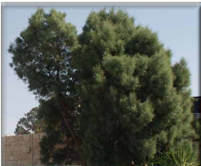
Tamariscul lui Avraam, de la Beer-Șeba