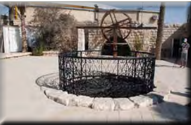
Fântânile patriarhilor: în prim plan – Fântâna lui Isaac; planul doi – Fântâna lui Avraam

Fântâna ne oferă apă – darul lui Dumnezeu, iar altarul ne oferă iertare, împăcare și închinare, unindu-ne cu Dumnezeu.