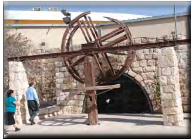
Fântâna lui Avraam de la Beer-Șeba

Cetatea a fost abandonată în toată perioada arabă. Turcii vor construi un fort, în jurul căruia se va dezvolta un mic orașel pe la