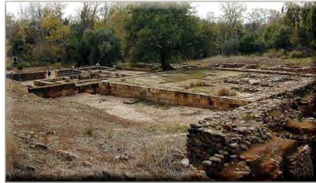
Tel Dan – incinta sacră; înălțimea și altarul

Campania siriană din timpul regelui Baesa a lăsat în urma ei o stelă (mic monument cu caracter comemorativ), ce comemora victoria siriană. Din această stelă s-a găsit o parte, care cuprinde următoarea inscripție: „...regii lui Israel..., casa lui David...”. Este cel mai vechi document arheologic ce atestă autenticitatea regelui David și dovedește renumele acestei dinastii; pentru străini, regii lui Israel erau urmașii lui David.