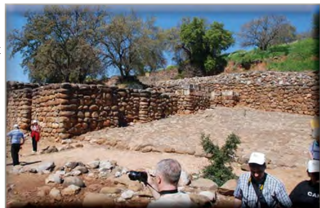
Tel Dan: Poarta I, cu „parcarea căruțelor” și zidurile cetății

După formarea Regatului de Nord al lui Israel, Ieroboam va alege localitatea Dan pentru a ridica aici un centru religios, format dintr-un mare altar și o înălțime în aer liber. Un complex asemănător a fost ridicat la Betel, localitatea cea mai sudică a Regatului. Cert este că cele două centre au funcționat și au atras populația spre ele, oprind fluxul normal