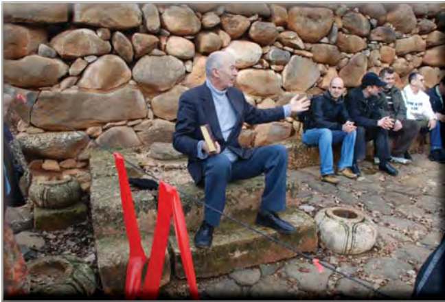
Poarta a II-a a cetății Dan, tronul regelui și banca bătrânilor

„Și toți fiii lui Israel au ieșit și adunarea s-a strâns, ca un singur om, de la Dan până la Beer-Șeba...” (Jud. 20,1)