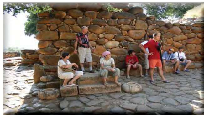
Poarta a II-a a cetății Dan, tronul regelui și banca bătrânilor